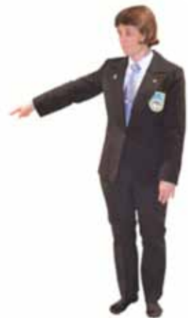
Pénalité pour sortie de tapis