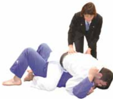
Sono-Mama \Leftrightarrow Yoshi