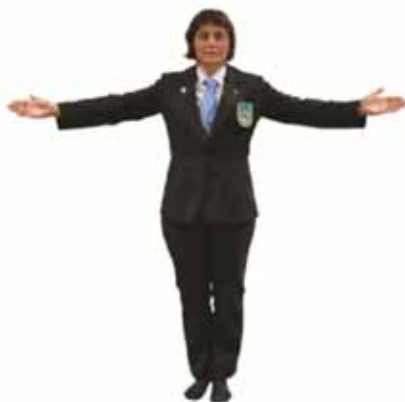
Inviter les combattants à entrer sur le tatami