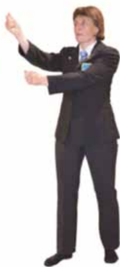
Pénalité pour garde croisée