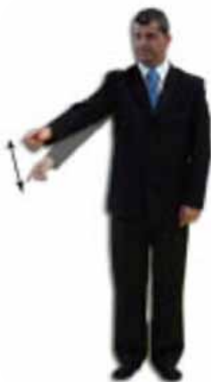
Shido sortie de tapis