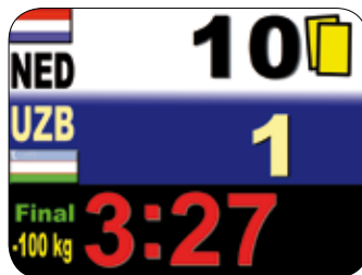
Tableau d'affichage électronique

EXEMPLE : Le blanc a marqué Waza-Ari et a été également pénalisé par un (1) Shido.