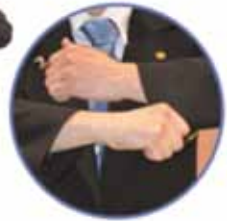
Pénalité pour doigts à l'intérieur de la manche