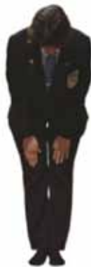
Salut en entrant et sortant du tatami