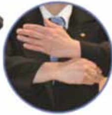
Pénalité pour prise "pistolet"