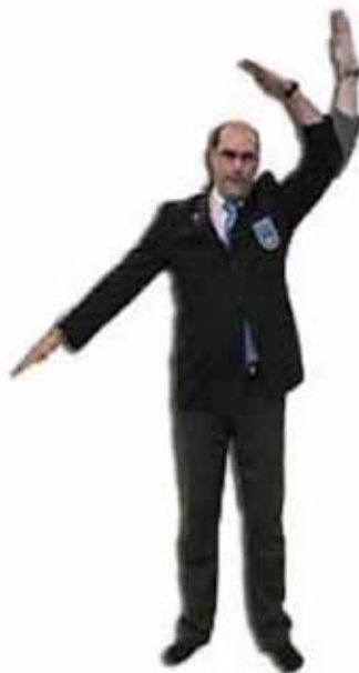
Pour annuler une opinion exprimée