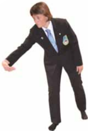
Pénalité pour saisie de jambe