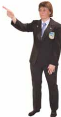
Attribuer une pénalité