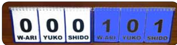
Tableau d'affichage manuel

Les chronomètres manuels doivent être utilisés simultanément avec l'équipement électronique, en cas de panne. Les tableaux indicateurs manuels doivent être disponibles en réserve.