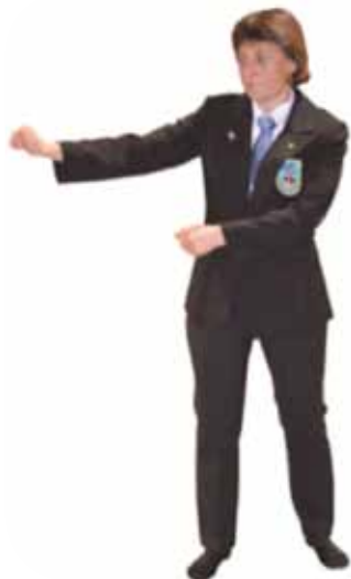
Pénalité pour attitude défensive