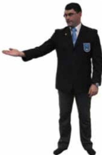
Appel du médecin