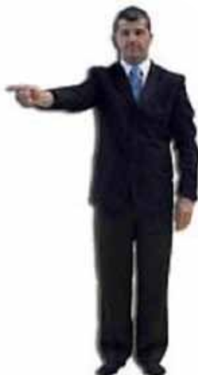
Pour attribuer une pénalité