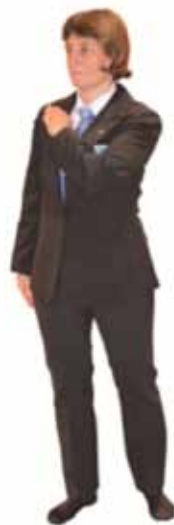
Pénalité pour refus de Kumi Kata (protection du revers)