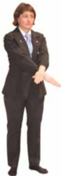
Ajuster le Judogi