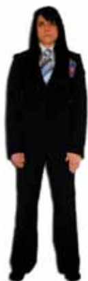
Position avant le combat